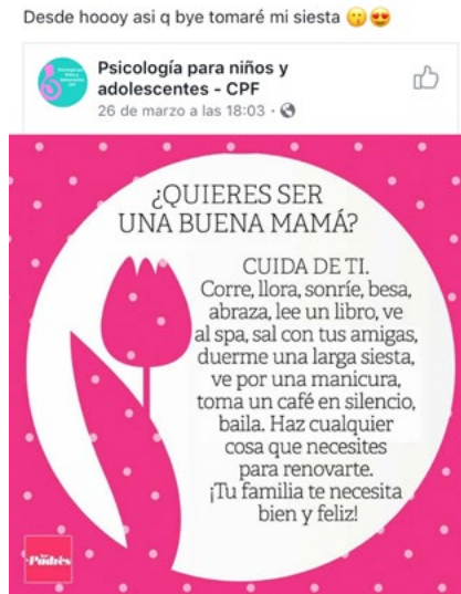
Figura 25. La buena maternidad