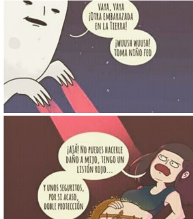
Figura 5. Eclipse y embarazo