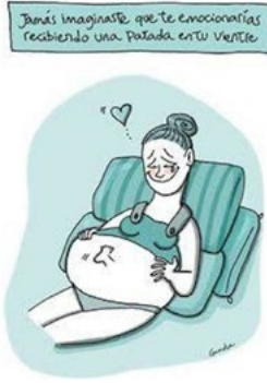
Figura 18. Patadas del bebé