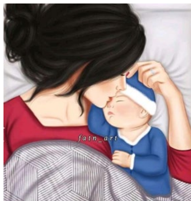
Figura 23. El amor de una madre

Tener un niño es conocer la llegada del príncipe azul 💙