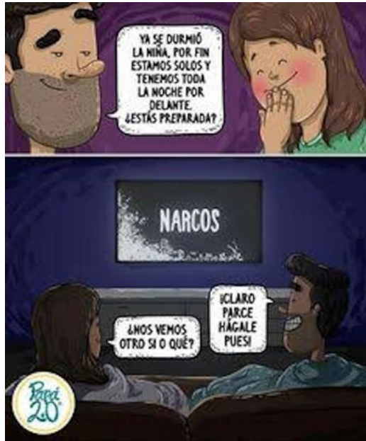
Figura 30. Cosas de papás