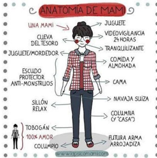
Figura 22. Anatomía de una mami