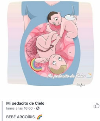
Figura 19. Ángeles del vientre