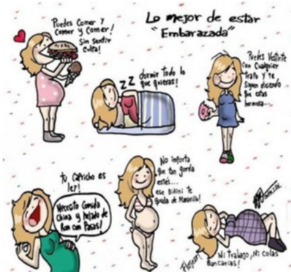
Figura 9. Los beneficios del embarazo