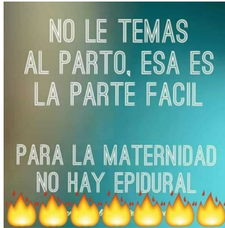
Figura 14. La maternidad más difícil que el parto