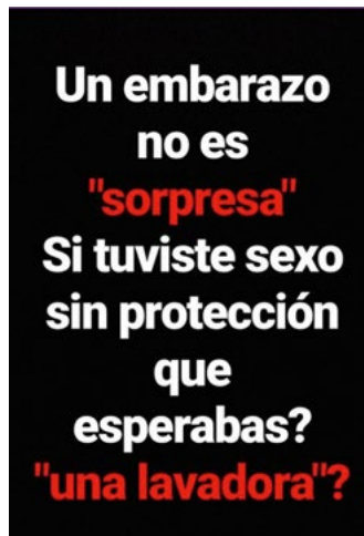
Figura 15. El embarazo sin protección