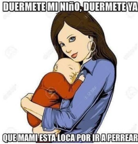
Figura 29. Mamás de fiesta