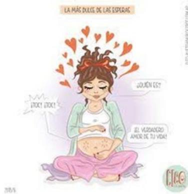
Figura 20. La más dulce de las esperas