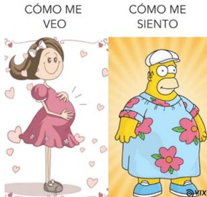
Figura 8. Percepción del cambio corporal