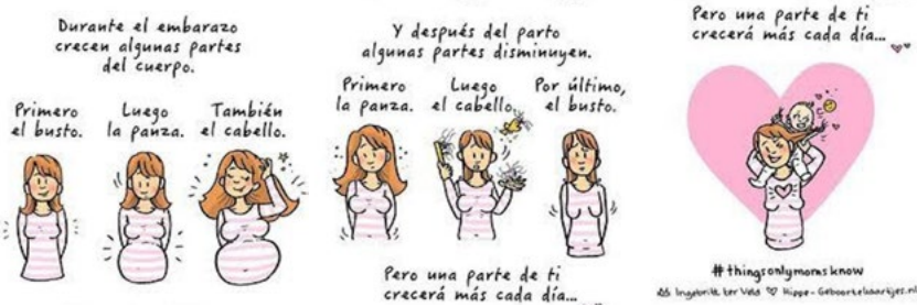
Figura 7. Cambios físicos