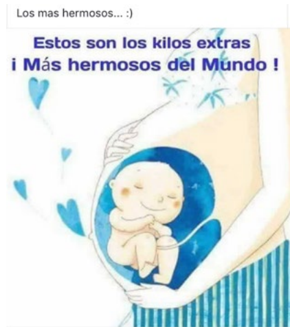
Figura 10. Los kilos extras