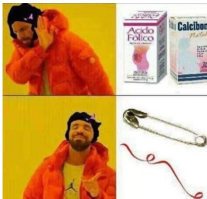
Figura 6. Segurito