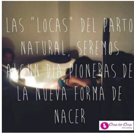
Figura 12. El parto natural

Adicionalmente, se observó que la imagen circuló en grupos de Facebook como: “Mamás y embarazadas de Guadalajara” y “Acupuntura y Maternidad”.