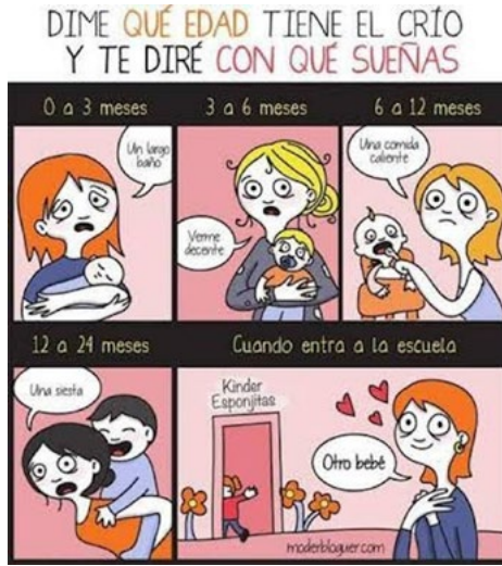
Figura 27. Agotamiento maternal