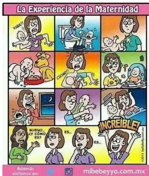
Figura 26. La experiencia de la maternidad