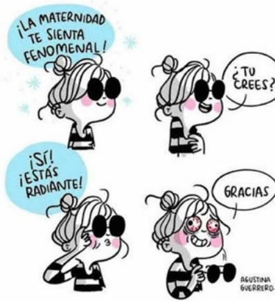
Figura 28. La maternidad te sienta fenomenal