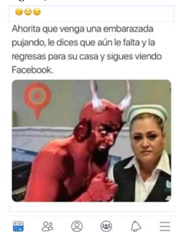
Figura 3. El actuar de las enfermeras