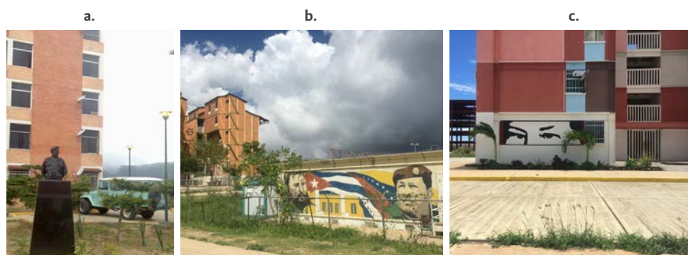
Figura 4. La presencia del “Comandante Eterno” en la GMVV

un “poder popular” como principal operador de los proyectos, a través del establecimiento de estrategias de autogestión y autogobierno comunitario, denominadas consejos comunales y comunas, para construir un estado comunal. El hábitat debe organizarse y relacionarse con la gestión de los servicios que lo componen, como movilidad, suministro de agua, energía, servicios alimentarios, etc., y, especialmente, la agricultura urbana y ciudadana, organizada y realizada principalmente por los propios habitantes. En general, la GMVV recurre a menudo a modelos de construcción de estructuras metálicas estandarizadas y prefabricadas, produciendo edificios de gran altura que superan las 10 plantas (figura 5). Otros elementos constructivos, como la instalación de ascensores, requieren una tecnología y una gestión sofisticadas para este contexto, mientras que el uso de pequeñas ventanas prefabricadas con una disposición repetitiva en la fachada refleja una escasa reflexión arquitectónica. Por último, durante el trabajo de campo, fue posible observar que la presencia e incluso la huella de los constructores internacionales influyen en la apropiación de este nuevo hábitat por parte de los habitantes. Algunos asocian sus barrios con las nacionalidades de los países aliados constructores, creando nuevas identidades, como el barrio chino, ruso, bielorruso, cubano, pero nunca venezolano (Wilson, 2020).