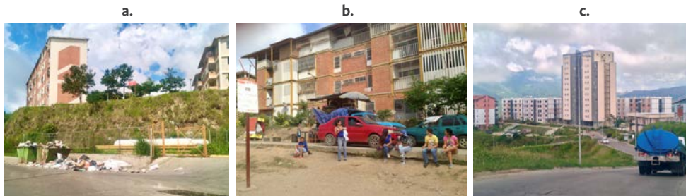
Figura 6. Servicios de base en la Ciudad Socialista Ciudad Caribia

Nota: a. Recolección de desechos. b. Transporte público c. Sistema de aguas.