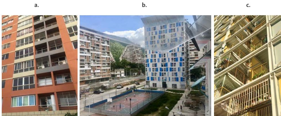
Figura 5. Fachadas de edificios construidos por la GMVV

Nota: a. Ciudad socialista Ciudad Tiuna, Caracas (acuerdo con China, Rusia, Bielorrusia). b. paneles de PVC, Montalbán, Caracas.