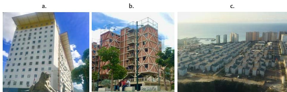
Figura 2. Morfología urbana de la GMVV