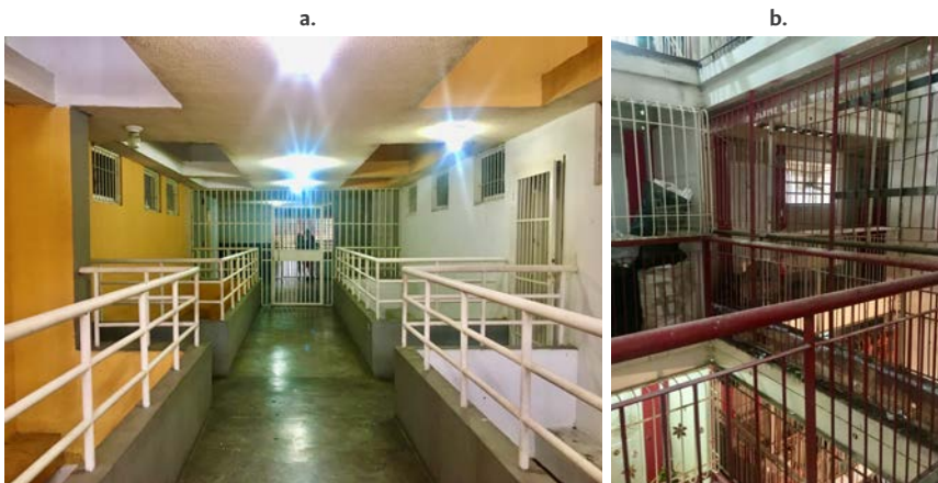
Figura 7. Rejas en los espacios comunes de la GMVV

Nota: a. Avenida Victoria. b. Urbanización Guillermo García Ponce (OPPPE 51) en Montalbán.