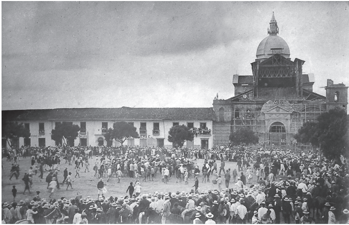
Figura 3. Catedral Nuestra Señora de La Pobreza en proceso de construcción a fines de la década de 1910