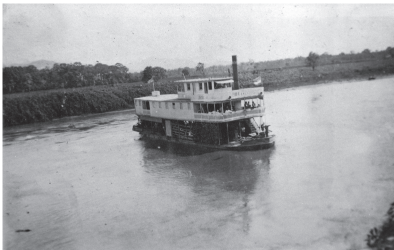
Figura 4. Vapor por el río Cauca, cerca al puerto de La Virginia. 22 de abril de 1926