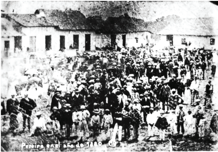
Figura 1. Plaza Victoria (1880), actual Plaza de Bolívar de Pereira