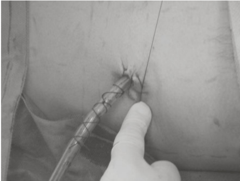
Figura 3. Sujeción y anclaje del tubo torácico y jareta para el cierre de retiro del tubo

puede dirigir el tubo al área basal y posterior (17). La profundidad ideal para introducir el tubo oscila entre 5 a 15 cm, debiendo estar seguros que todos los orificios de la sonda estén dentro del espacio pleural y que el orificio más proximal este al menos a 2 cm mas allá del margen de la costilla, de lo contrario podríamos ocasionar enfisema subcutáneo. También se puede usar un estilete endotraqueal maleable, para direccionar de forma apical el tubo. Dicho maleable se colocó en el interior del tubo pleural, dándole la curva adecuada para la colocación (debemos recordar siempre retirar el estilete al término de la colocación, en caso de usar esta técnica) (19). Siempre se debe mantener pinzado el extremo distal del tubo hasta que se coloque el sistema de recolección.