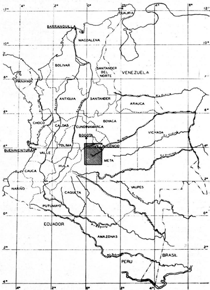
MAPA N° 1.—Localización en Colombia del Mapa N° 2.