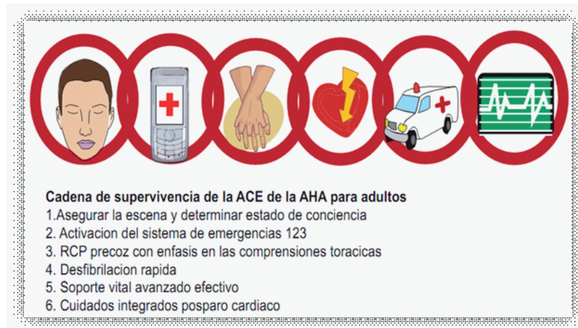
Figura 2b. Cadena de Sobrevivencia, Guías 2010 (Se agregó el eslabón final, cuidados integrales post paro cardíaco)

Desde 1979 cuando el médico cirujano en Portland USA, Arch Diack (7) implementó el DEA para uso fuera del hospital, se ha venido utilizando este recurso especialmente en los países desarrollados (8,9), porque hay una cantidad de estudios que corroboran la efectividad de la reanimación básica cuando el paro cardíaco es secundario a una arritmia como la taquicardia ventricular sin pulso (TVSP) o la fibrilación ventricular y se cuenta con un DEA de manera precoz, que se convierte en el único medio de resolver esta arritmia fatal. (10-14).