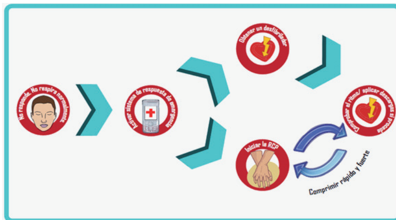
Figura 2a. Cadena de Supervivencia, Guías 2010, (énfasis en las compresiones)

cadena, el manejo del paciente que ha salido del paro cardiaco (Figura No.2b) (6).