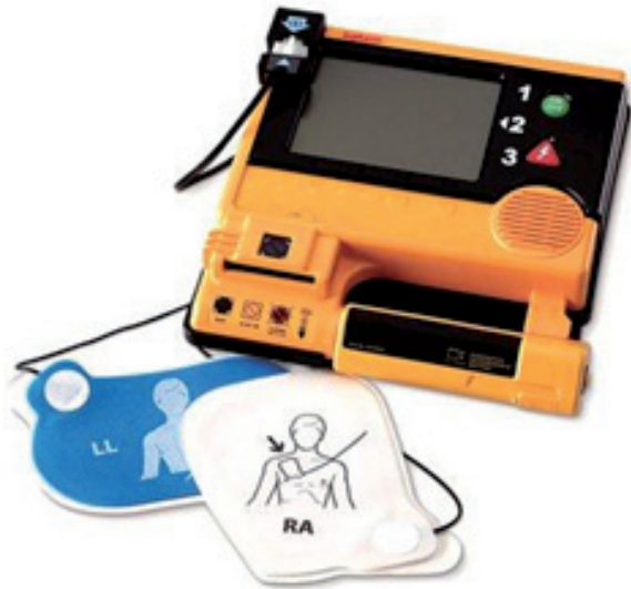
Figura 3. Desfibrilador Automático Externo DEA

La RCCP Básica consiste en las maniobras de reanimación establecidas a través del tiempo por Consenso de expertos que pertenecen a los Consejos de reanimación en el mundo, liderados por el Comité Internacional de enlace en Reanimación ILCOR (17,18), en ellas es claro que hay que seguir una secuencia de manejo organizada, a través de los eslabones de la cadena de supervivencia (19).