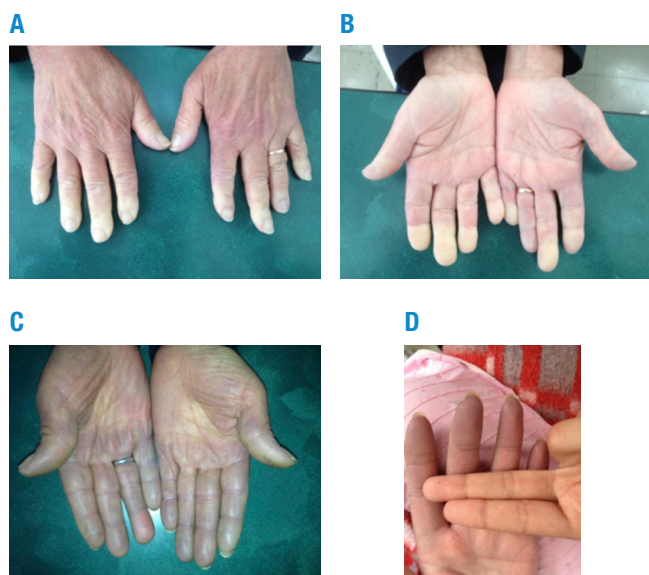
Figura 2. Fotografías tomadas de pacientes con fenómeno de Raynaud durante la consulta. Nota. A y B: Fases de isquemia –ataque blanco–. C y D: Fases de cianosis –ataque azul–.

El Ante un paciente que refiere síntomas y signos sugestivos de fenómeno de Raynaud, sin duda lo más importante y útil es la realización de una historia clínica completa, que haga énfasis en la revisión por sistemas, pues permite identificar signos o síntomas sugestivos de enfermedad de base que condicione una causa secundaria. En el enfoque, debe determinarse, por anamnesis, si el cuadro corresponde a un fenómeno de Raynaud o si, por el contrario, puede explicarse por otra causa. Para lo anterior, se debe indagar sobre los territorios comprometidos, dado que el fenómeno de Raynaud se presenta en todos los dedos de la mano; generalmente inicia en el segundo o cuarto dedo y luego se presenta en los demás.