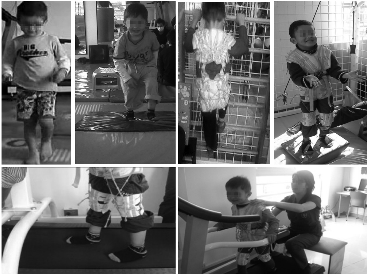
Figura 1. Testimonio gráfico del paciente realizando el tratamiento con el método Therasuit.

altas expectativas en relación con un enfoque de intervención que ha sido efectivo en casos aislados. Ahora bien, este enfoque merece ser planteado y desarrollado en futuras investigaciones en las que se puedan establecer bases de evidencia científica que permitan profundizar y afianzar el conocimiento en rehabilitación.