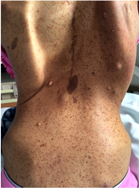
Figura 1. Evidencia del examen físico al ingreso.

Se presenta el caso de una mujer de 29 años de edad que ingresa al servicio de urgencias por cuadro clínico de 12 horas de evolución de melenas. 8 días antes de este cuadro clínico estuvo hospitalizada por rectorragia y se le realizó endoscopia de vías digestivas altas y colonoscopia sin encontrar sitio de sangrado. La paciente reporta antecedente personal de neurofibromatosis tipo 1 y cirugía correctiva de escoliosis dorsal y antecedente familiar de neurofibromatosis tipo 1 en el padre. Al examen físico presenta múltiples efélides, manchas color café con leche, neurofibromas y escoliosis dorsal (Figura 1).