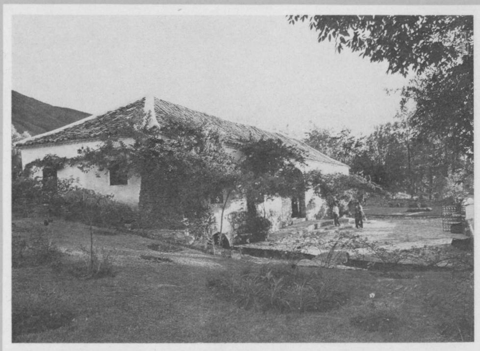
VILLA DE LEYVA - BOYACA -