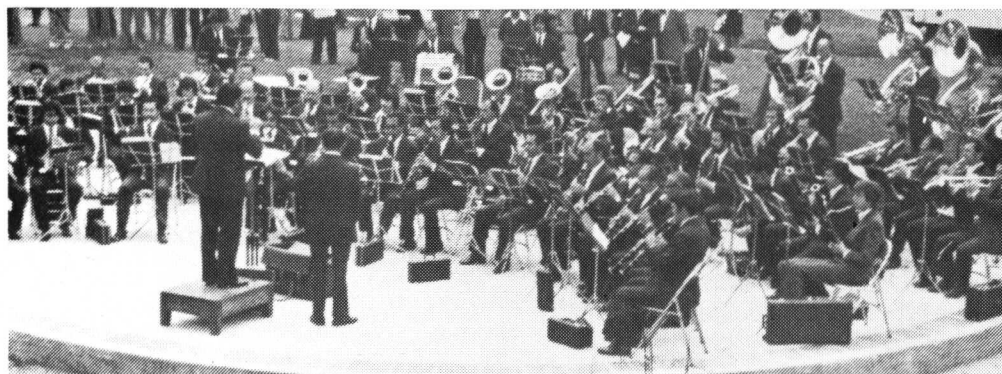
Grandes conciertos en la Plaza Santander.

Iniciados hace más de tres años, los cursos libres cumplen una gran labor de extensión universitaria y cuentan con los mejores especialistas en los temas y