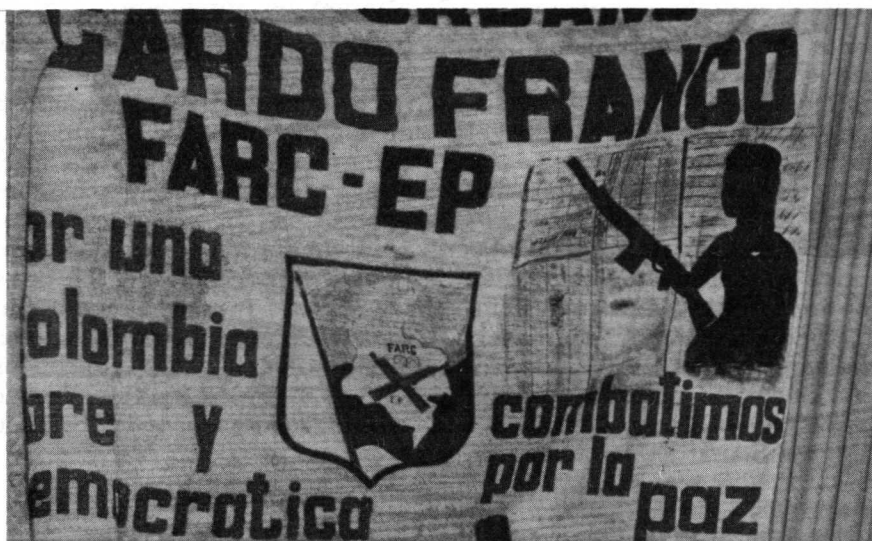
Coordinadora guerrillera, ¿atrapada en su doble juego?

La combinación de todas las formas de lucha, no es, hoy en día,