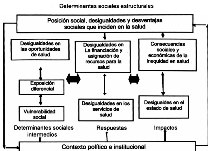
Figura 2. Modelo para el análisis y seguimiento de la equidad en salud

Si las mujeres, por ejemplo, tienen ciertas ventajas naturales para tener una vida más prologada, la igualdad en la duración de la vida no puede alcanzarse a costa de discriminar su acceso a los servicios de salud para dar preferencia a los hombres (5). En este caso, en aras de la equidad en los resultados, se violaría la imparcialidad en los procesos.