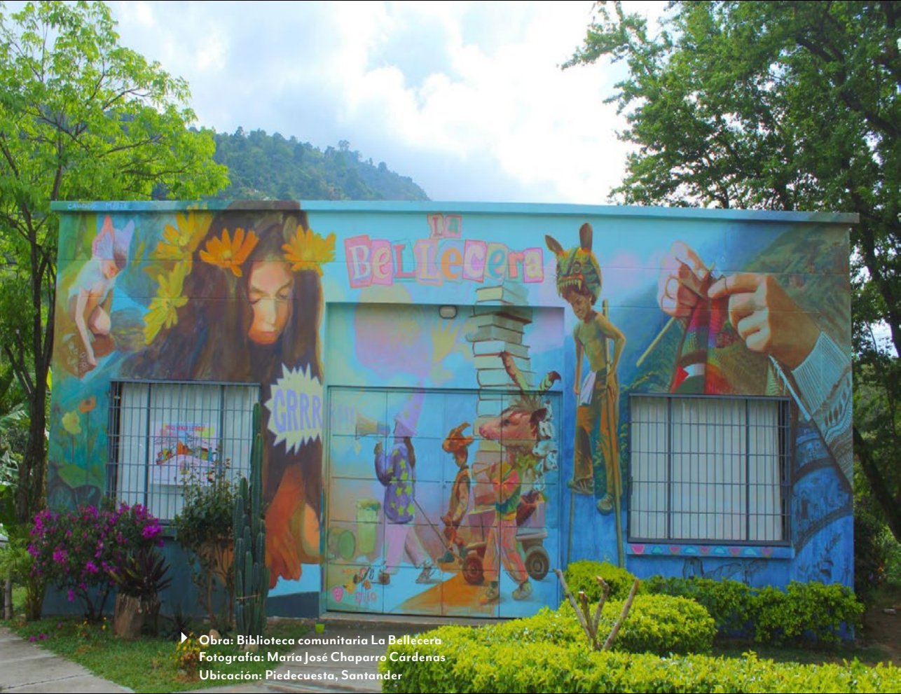
► Obra: Biblioteca comunitaria La Bellecera Ubicación: Piedecuesta, Santander