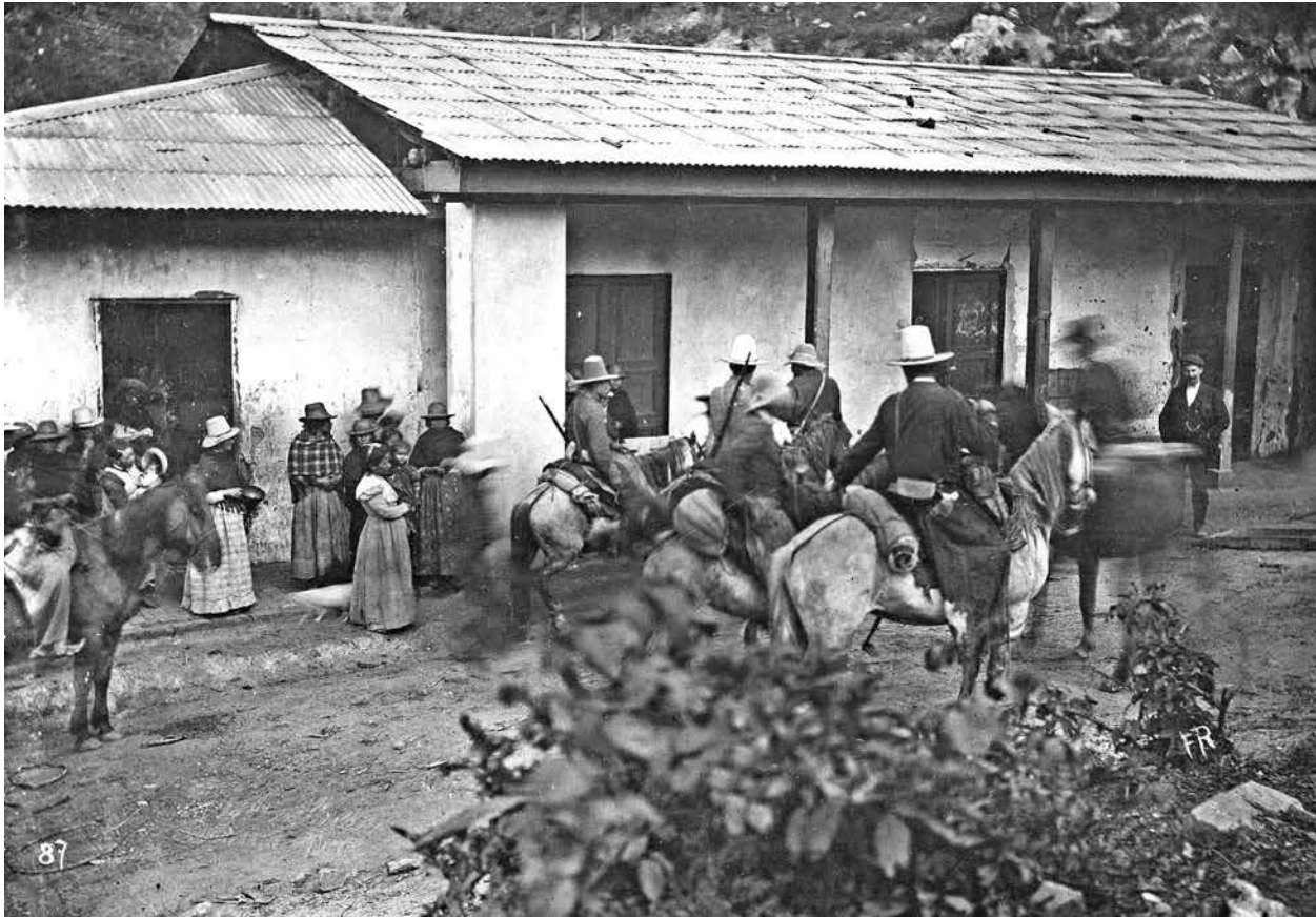
Anónimo Bogotá, Colombia. s.f. Universidad Nacional de Colombia, Archivo Central e Histórico, Fondo Ernst Röthlisberger Serie: Álbum Fotográfico Caja No. 3