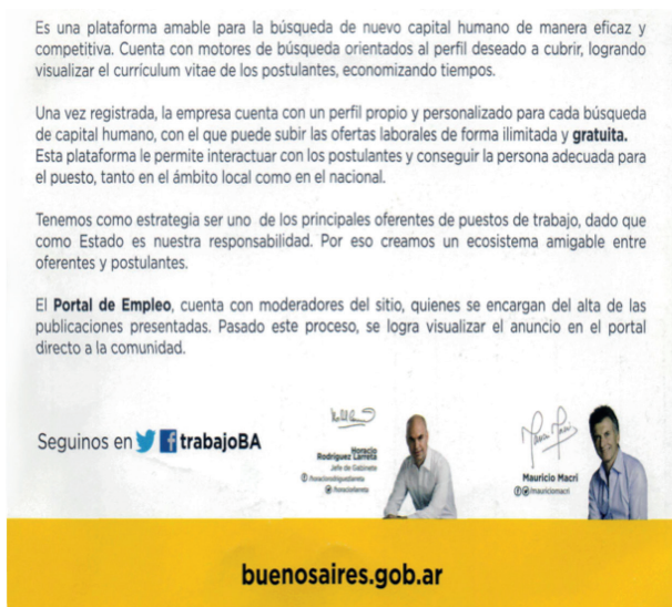
Figura 3. Portal de Empleo 2