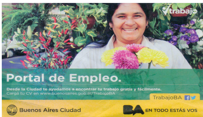
Figura 4. Portal de Empleo 3