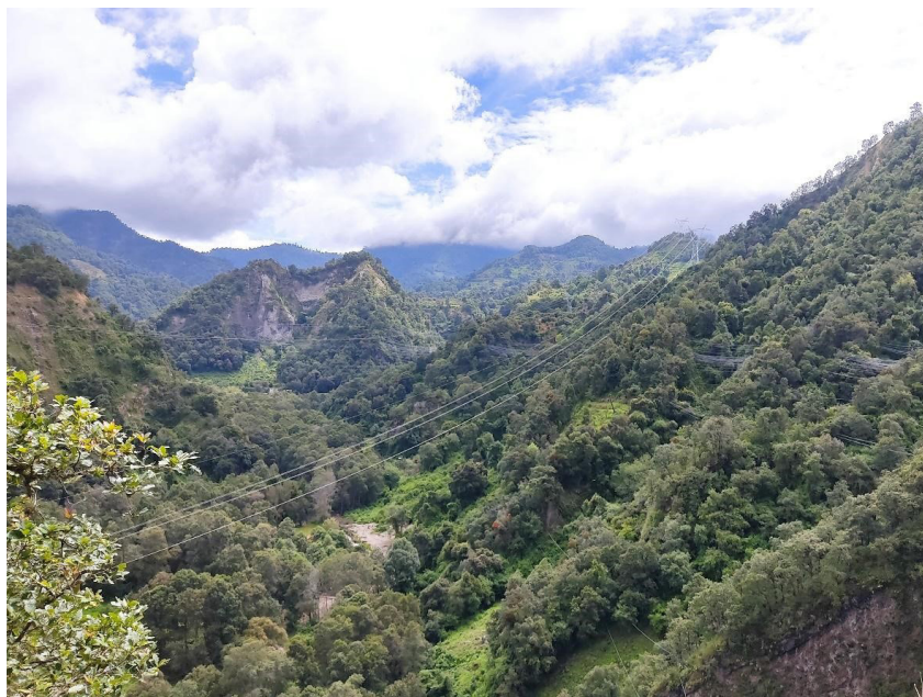
Figura 3. La zona de Amatzinac vista desde el puente de los comuneros y ejidatarios. Se pueden apreciar varias mangueras colocadas en las alturas